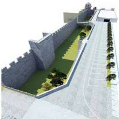
Rendering del progetto di recupero delle Mura